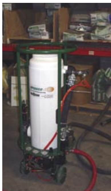
Minsta portabla blästerutrustningen.