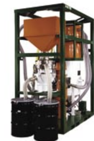
Bläster och återvinnare, allt i ett.